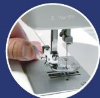
Szybka wymiana stopki