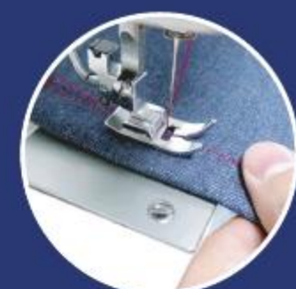
Szycie grubych materiałów