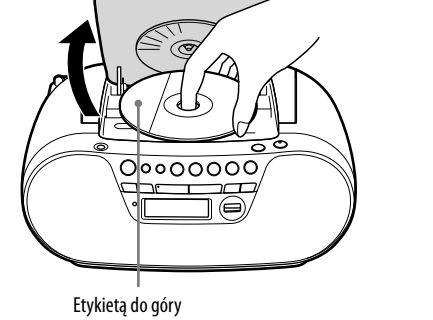
Etykieta do góry