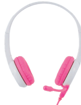
BUDDYPHONES STUDYBUDDY PINK