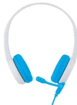
BUDDYPHONES STUDYBUDDY BLUE